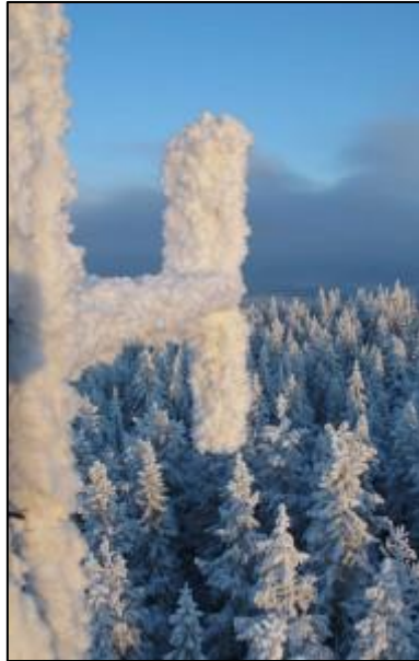
En liten bit Leksandsrepeater mitt i vintern!