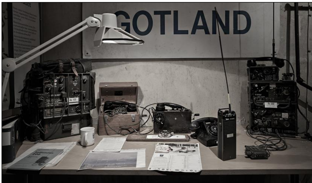
Sambandsutrustning i Tingstäde Fästning, kan ses i FROs radiomuseum därstädes. Ra 122 t vä och ra 200 t hö. OBS FROs kaffemugg!!!